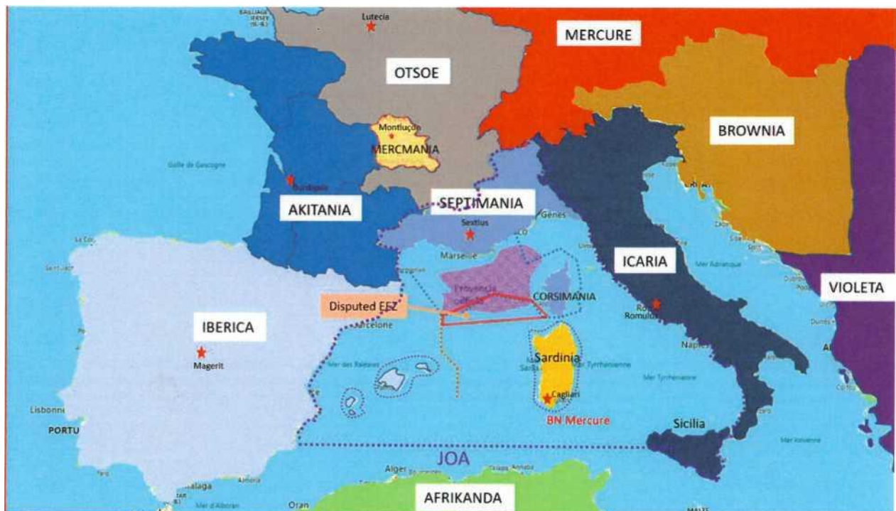
Зона боевых действий